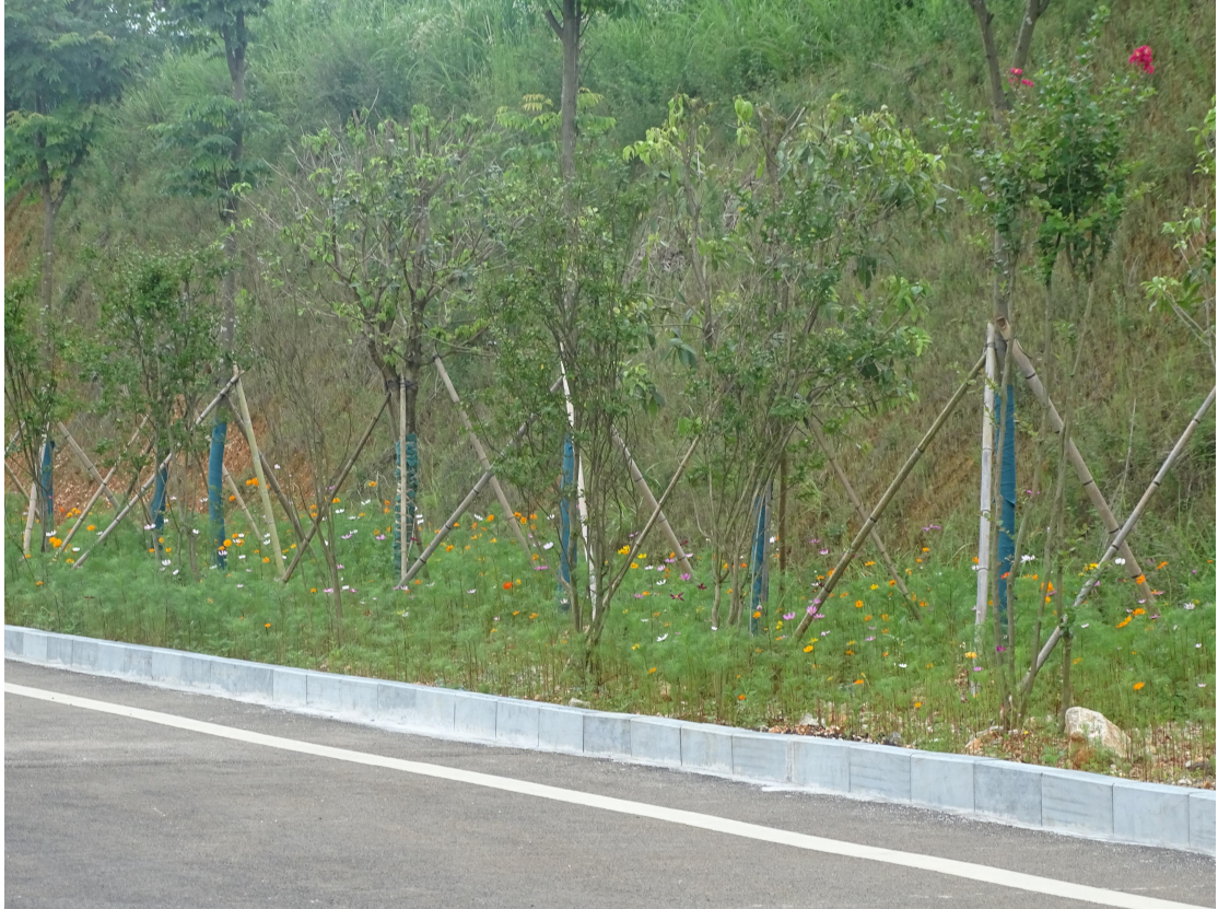
图 10 建设区植物措施实施效果