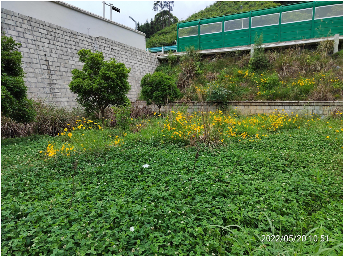
图 17 建设区植物措施实施效果