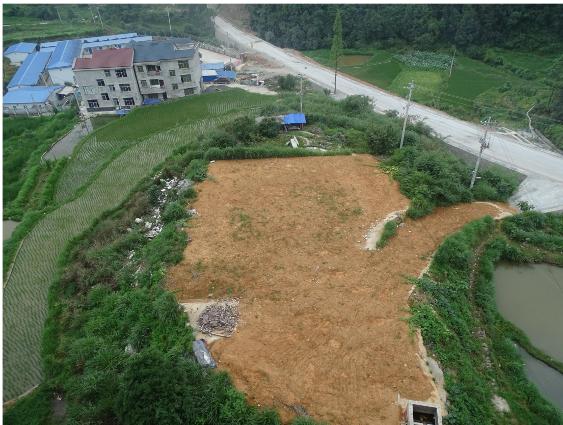
图 18 临时施工营地治理航拍效果