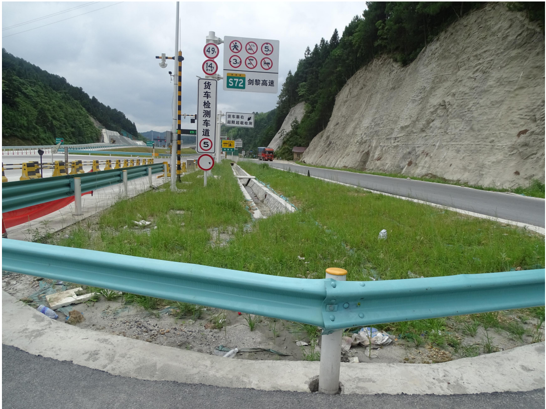
图 14 建设区植物措施实施效果