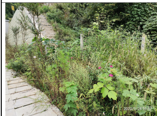
图 3 水土保持植物措施属无危害扰动区域