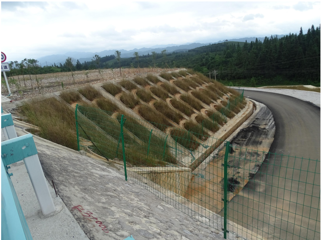
图9 建设区工程措施实施效果