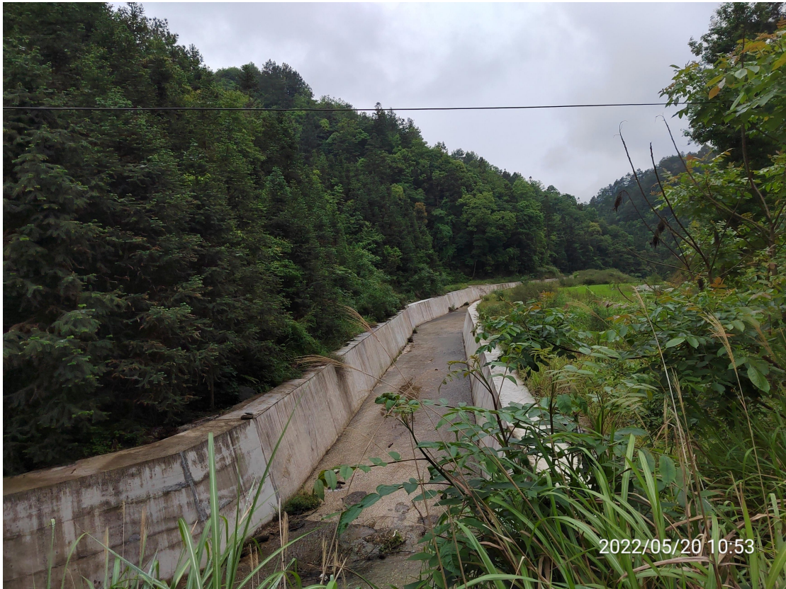
图2 建设区工程措施实施效果