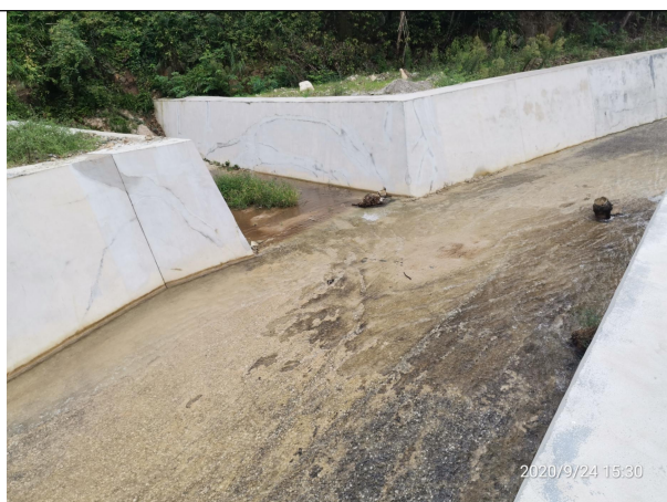
图 4 工程措施属无危害扰动区域