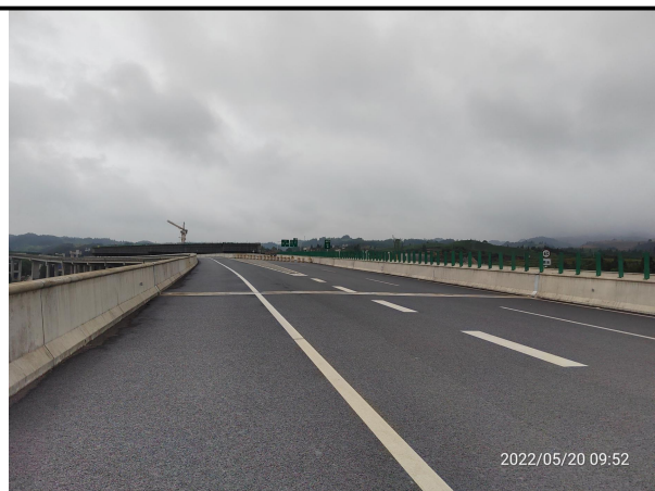
图 2 道路路面属无危害扰动区域