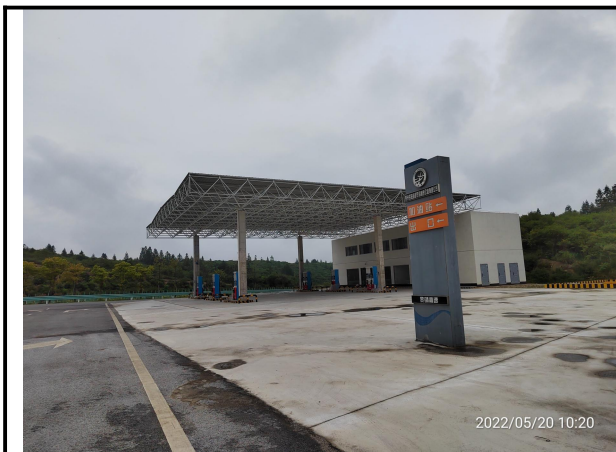
图 1 硬化地面属无危害扰动区域