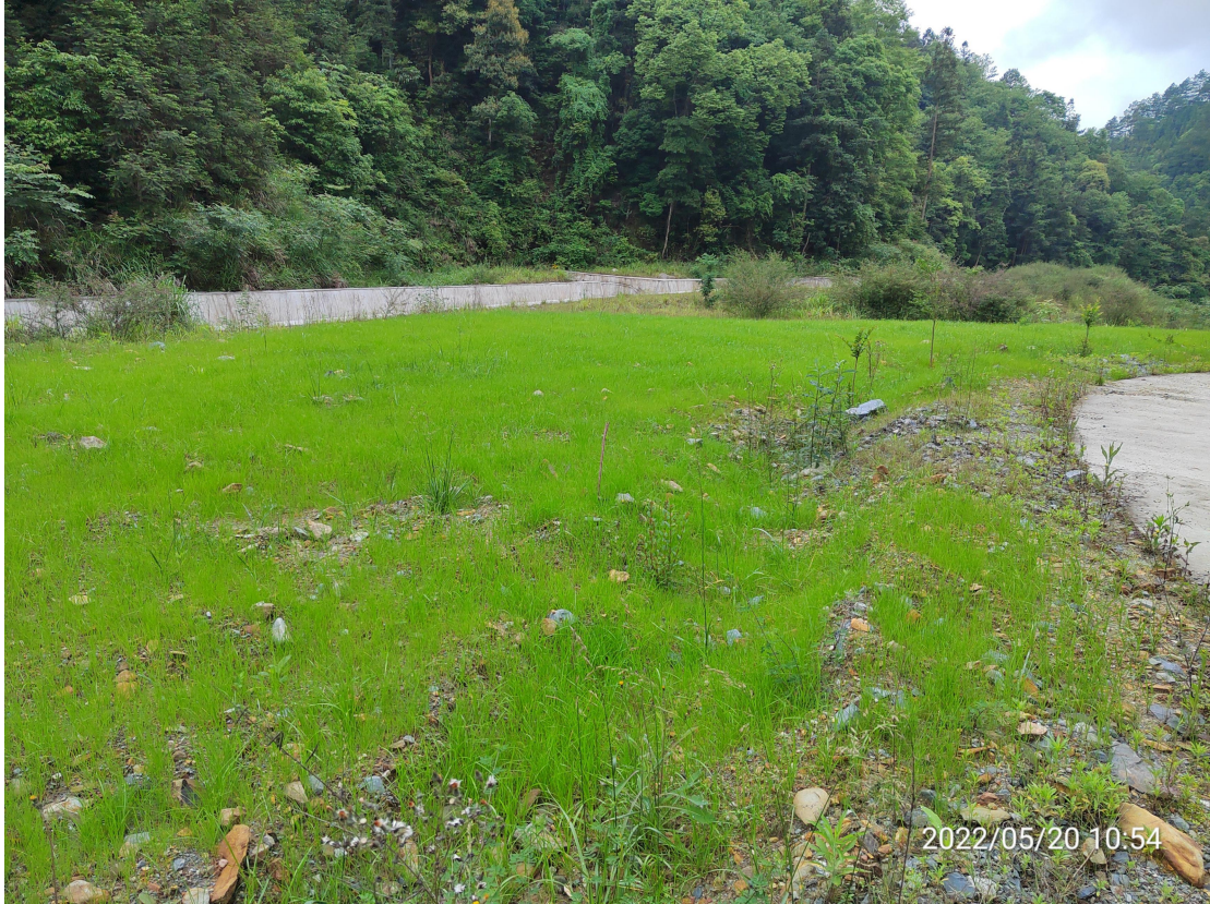
图 16 建设区植物措施实施效果