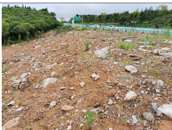
图 4 局部裸露属治理未达到防护要求的区域