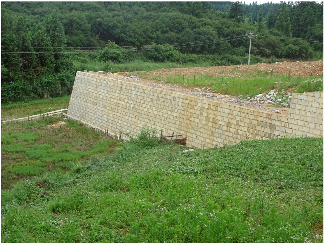
图 11 建设区植物措施实施效果