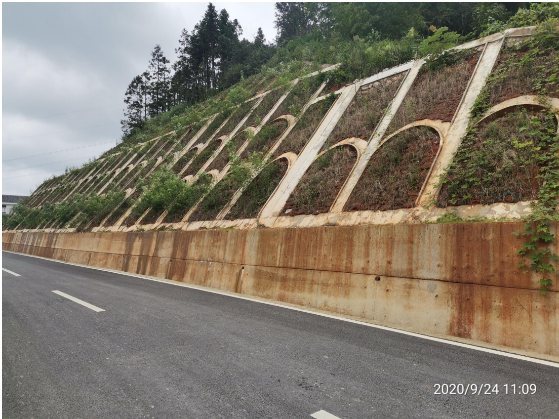
图7 建设区工程措施实施效果