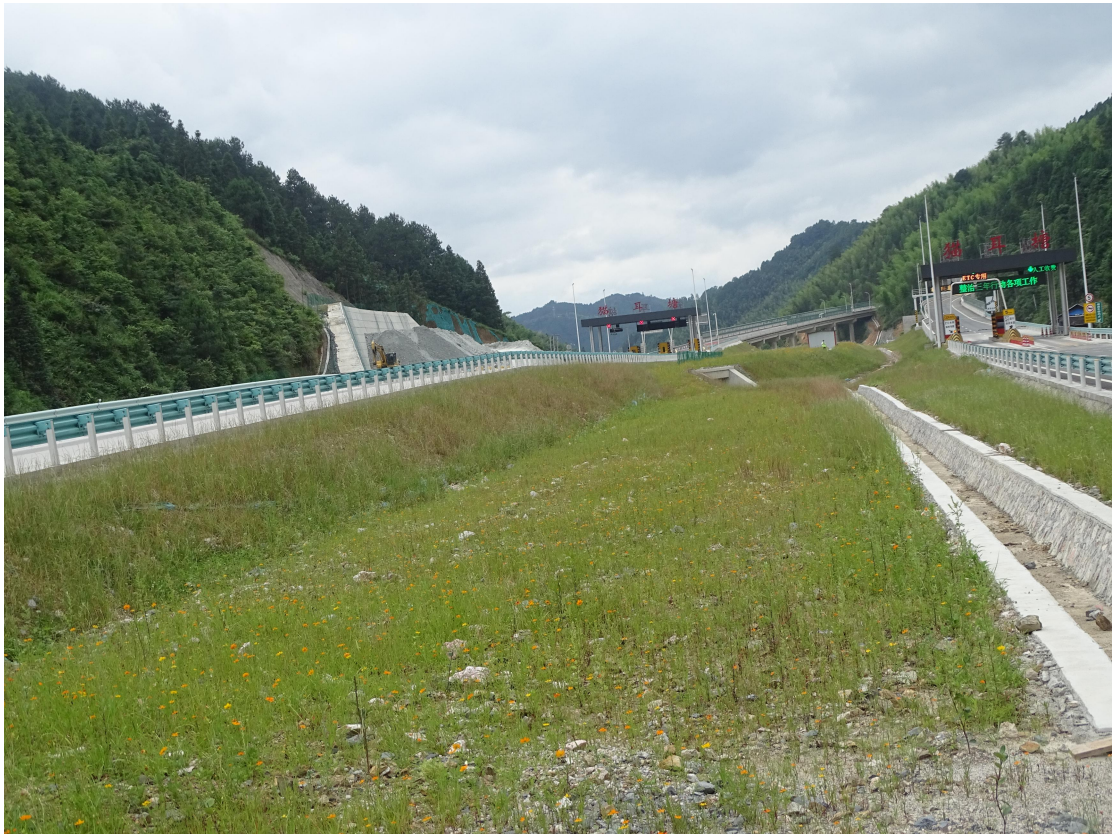
图 15 建设区植物措施实施效果