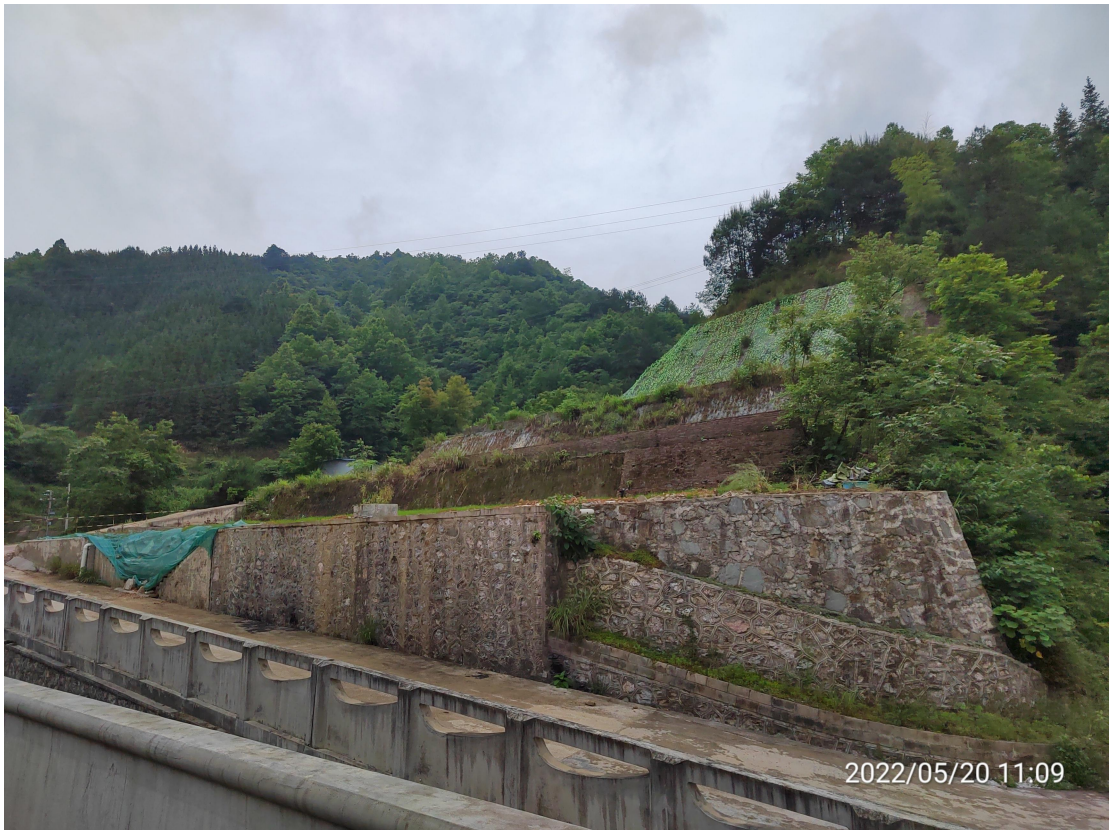
图3 建设区工程措施实施效果