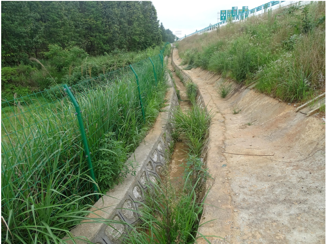
图8 建设区工程措施实施效果