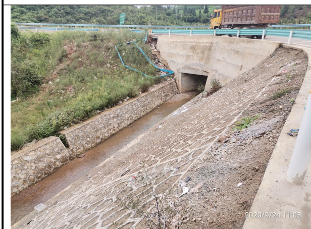
图 3 工程措施属无危害扰动区域