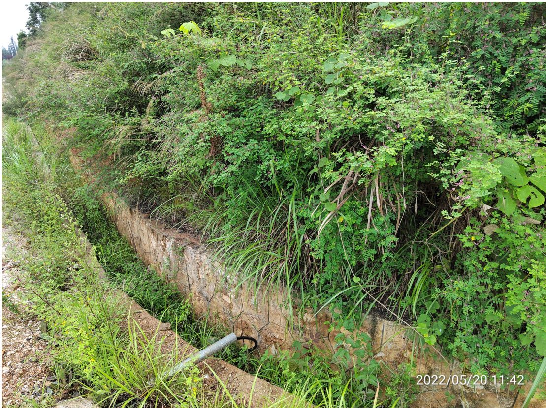
图5 建设区工程措施实施效果