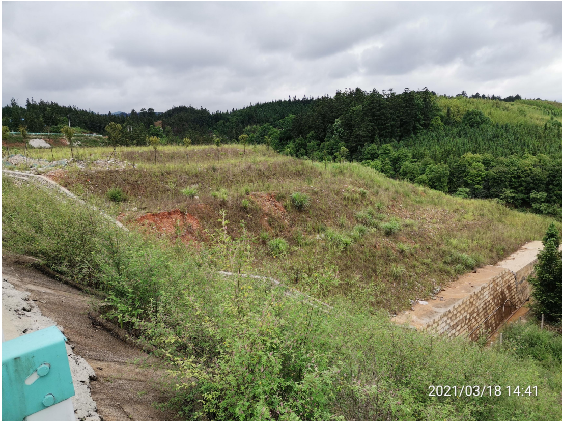
图6 建设区工程措施实施效果