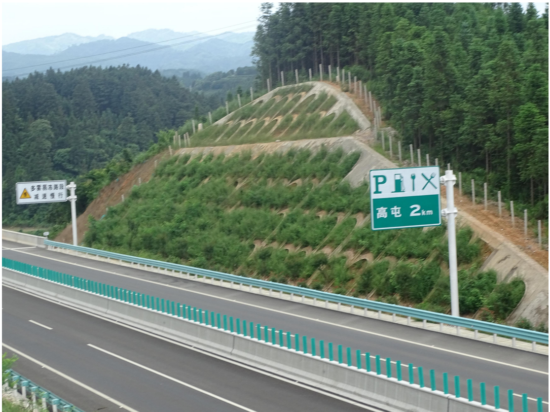
图 13 建设区植物措施实施效果