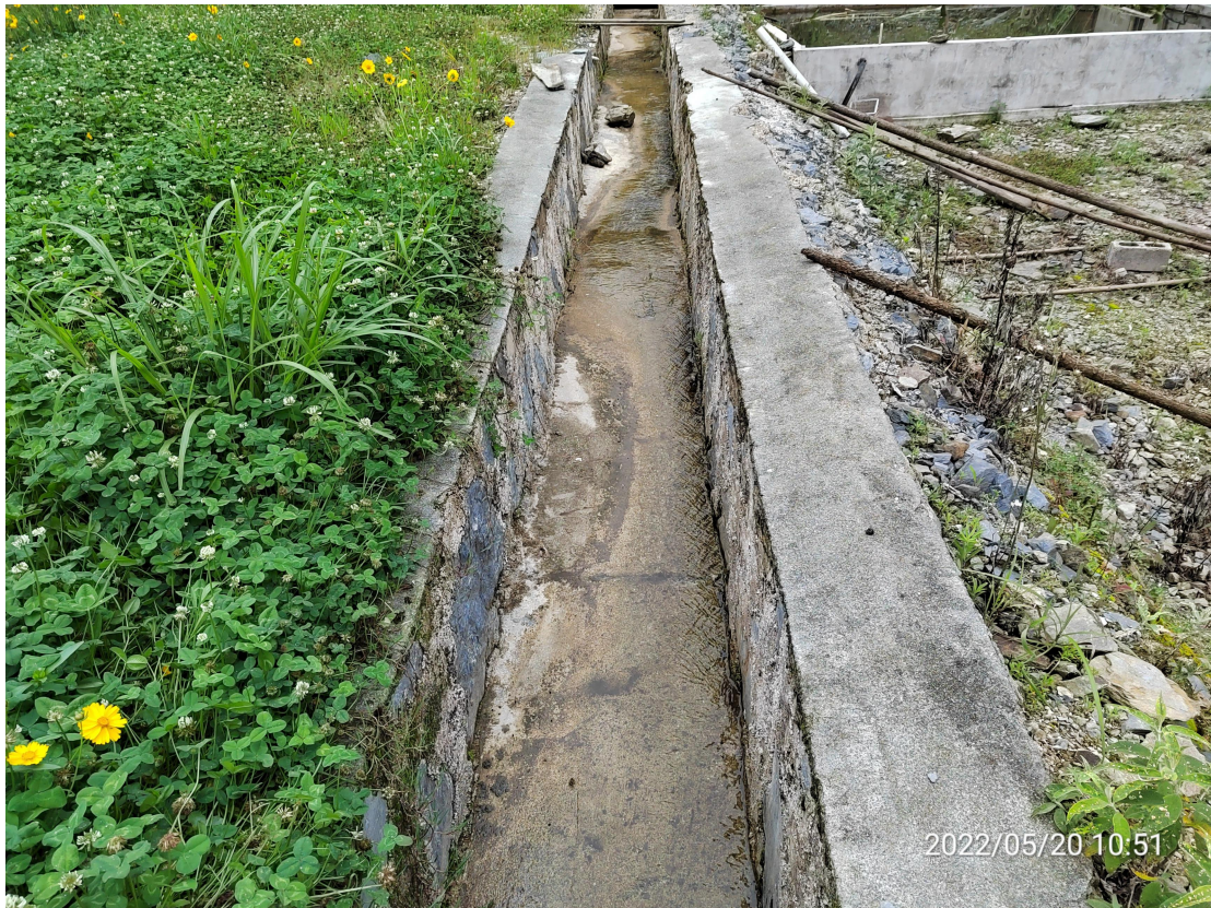
图1 建设区工程措施实施效果