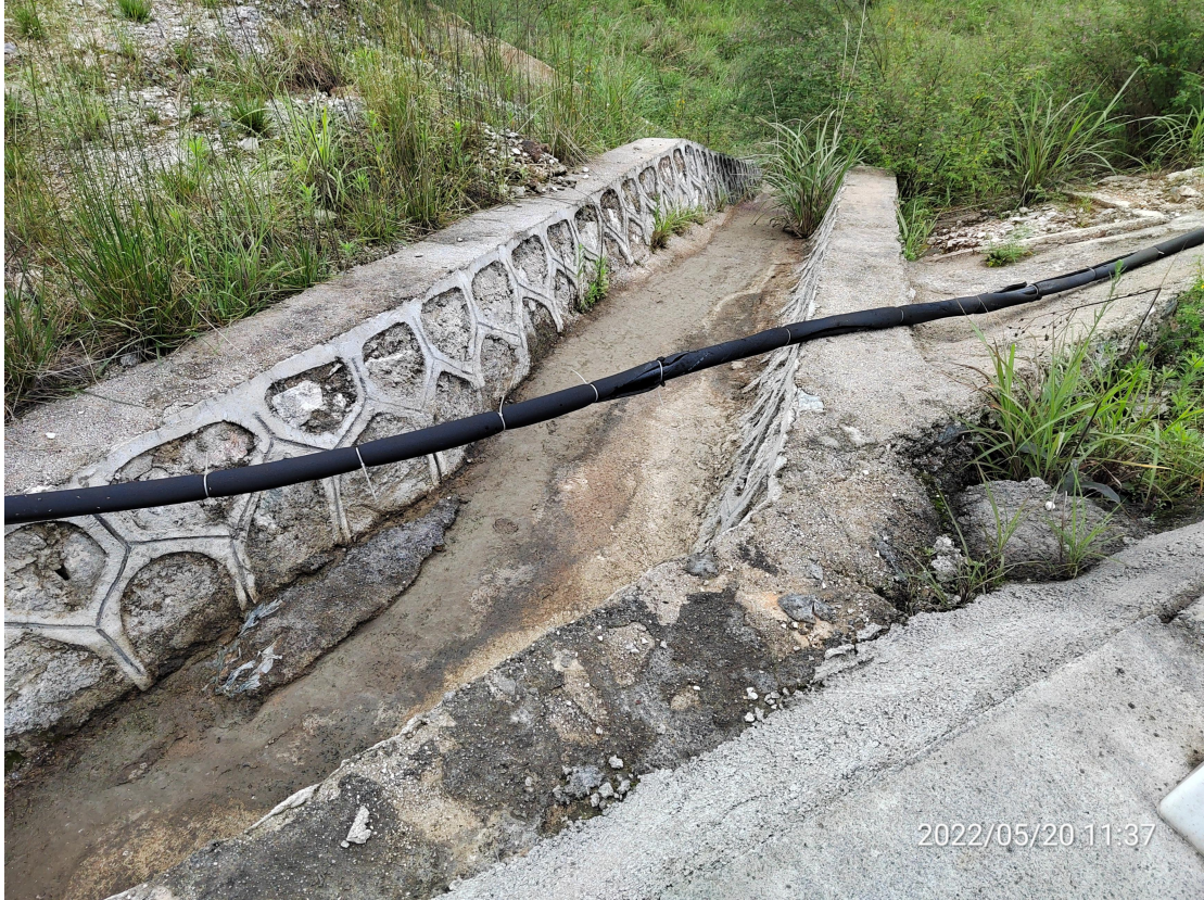
图4 建设区工程措施实施效果